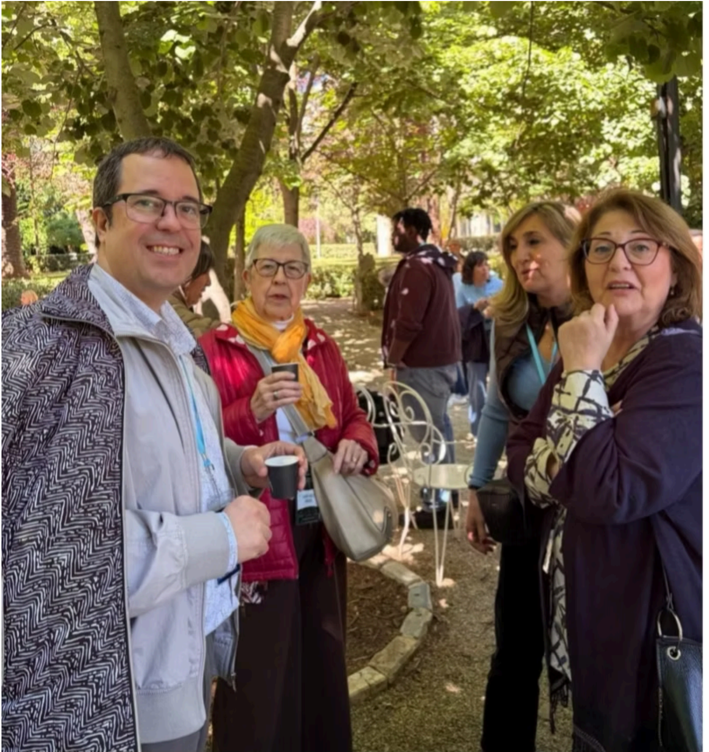
El presi, su madre Amparo y dos amigas más, disfrutando de un descanso