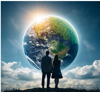
Generada por IA. Pareja admirando un planeta

La Tierra, como organismo vivo, atraviesa profundas transformaciones. Estas mutaciones repercuten tanto en el plano físico como en el espiritual, y cada uno de nosotros participa de ese proceso mediante la ley de afinidad y resonancia. Pensamos, vibramos, emitimos energías y recibimos de vuelta aquello que corresponde a la calidad de nuestras propias vibraciones. Por ello, la construcción de un mundo mejor comienza necesariamente por la transformación individual.