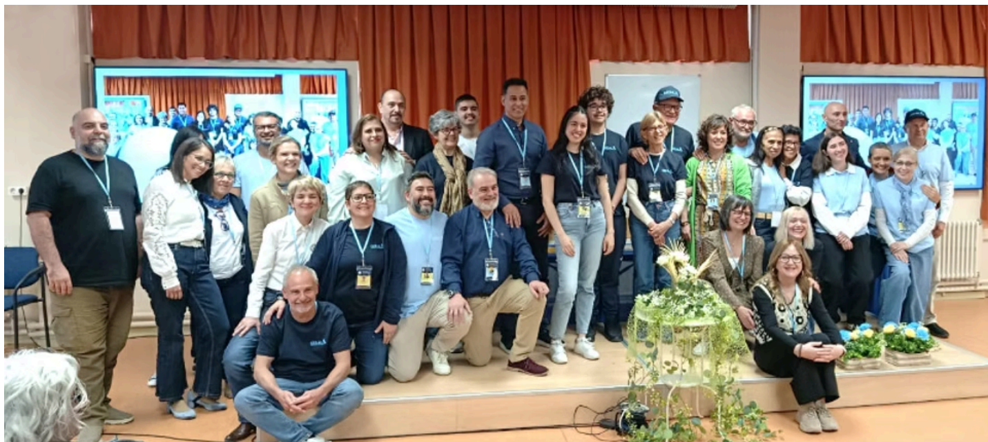
Foto final del congreso, con todos los voluntarios y ponentes

En el presente artículo me gustaría explicaros cómo fue el II Congreso Médico-Espírita GEEAK que celebramos los días 16 y 17 de mayo de este año. Os hablaré de algunos detalles significativos que merecen ser recordados.