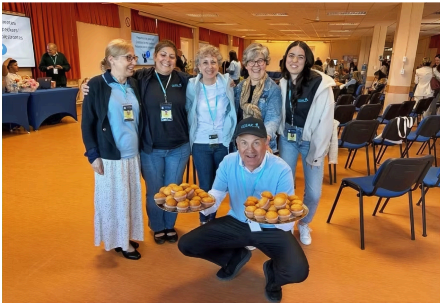
Alegría, amor y buenos alimentos no faltaron